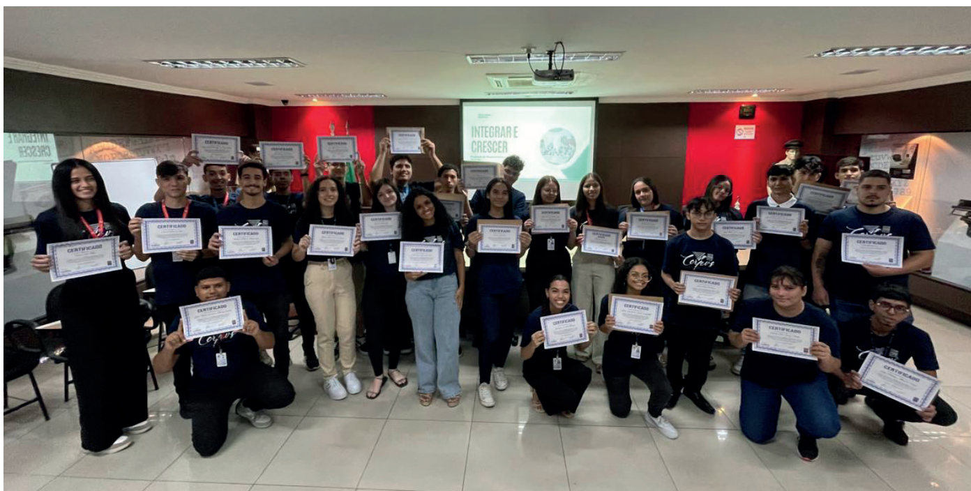
1ª Turma do Programa Jovem aprendiz COPRVS

A Corpvs Segurança iniciou este ano o programa “Integrar e Crescer”, uma iniciativa voltada para o aperfeiçoamento de jovens aprendizes que já atuam na empresa. O objetivo é prepará-los tanto para o mercado de trabalho quanto para futuras oportunidades dentro da própria empresa.