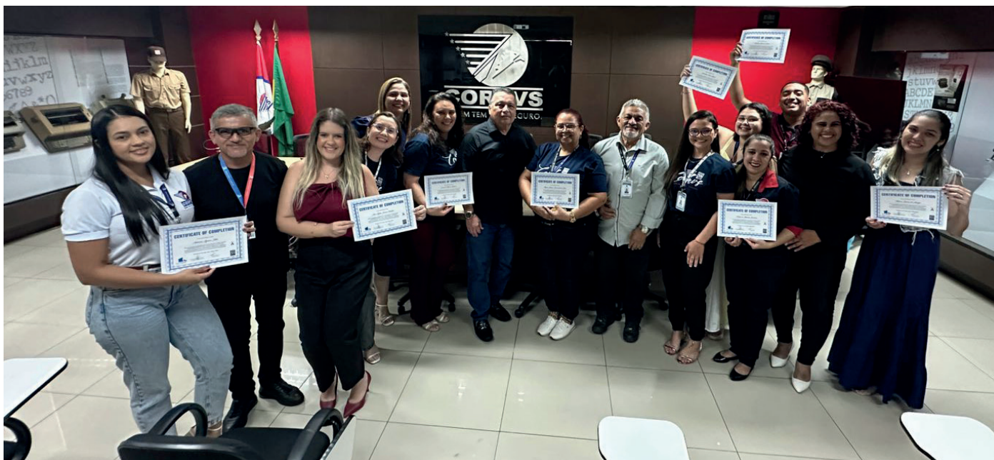
1ª Turma do Programa de Inglês Básico

A Corpvs Segurança passou a oferecer curso de inglês para seus colaboradores. A primeira turma já teve as aulas iniciadas e sua duração será de seis meses. O curso é voltado para a conversação e o atendimento ao cliente, com foco na comunicação prática e eficaz.